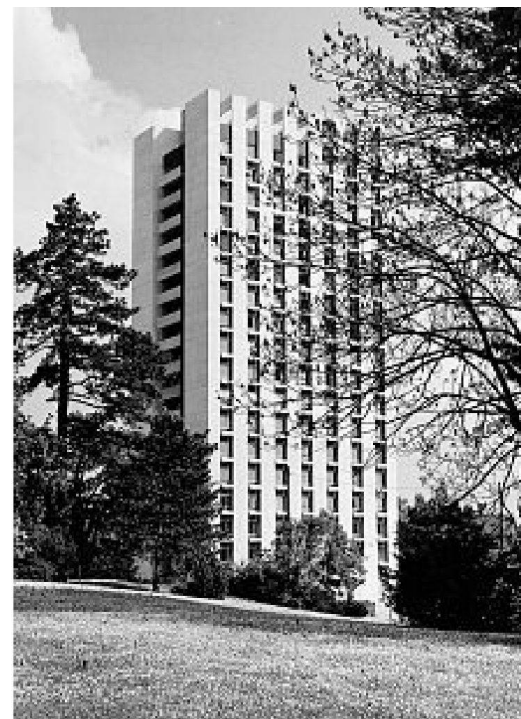
Schwesterhaus des Universitätsspitals Zürich (1952–59)