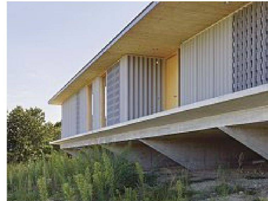
Nordostfassade mit perforiertem Eternit