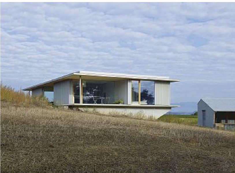
Wohnhaus und Stall von Süden