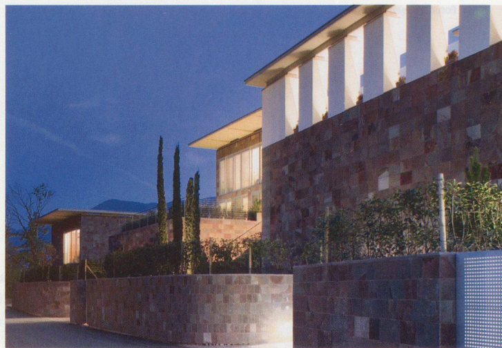
3. Ausbautetappe ETH Hönggerberg, Chemiegebäude, Zürich 2001/04 (links) und drei Stadtvillen in Lugano, 2005/07

setzung mit der klassischen Moderne und dem italienischen Rationalismus. Stets wird eine vertiefte Analyse von Ort und Aufgabe spürbar, die seinen Arbeiten eine konzeptionelle Strenge verleihen, die formal eigenständig umgesetzt, oft eine wohlthuende und selbstverständliche Eleganz ausstrahlen.