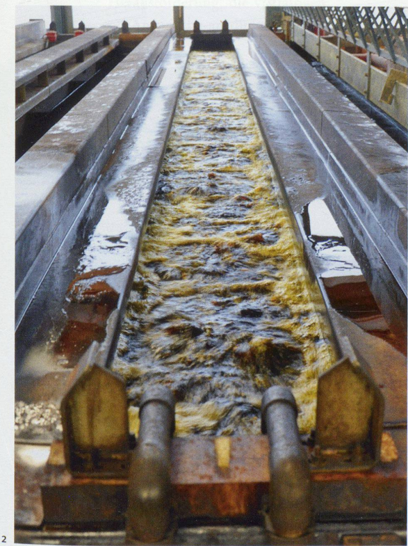
1 und 2 Im letzten Tauchvorgang wird die Chromatschicht aufgebracht. Die gelbe Farbe ergibt sich aus der Zusammensetzung der Chromatierlösung.