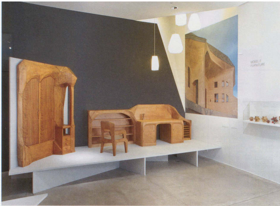
Einbauelemente im anthroposophischen Stil, 1920er Jahre