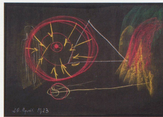
Rudolf Steiner, Wandtafelzeichnung, 1923

«Rudolf Steiner – Die Alchemie des Alltags» im Vitra Design Museum in Weil am Rhein, bis 1. Mai 2012. – Parallel zur gleichnamigen Publikation des Vitra Design Museums ist gleichzeitig erschienen: «Rudolf Steiner und die Kunst der Gegenwart» als Begleitbuch zur gleichnamigen Ausstellung des Kunstmuseums Wolfsburg und des Kunstmuseums Stuttgart im DuMont Buchverlag Köln.