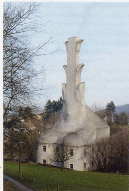
Heizhaus in Dornach, 1913/14