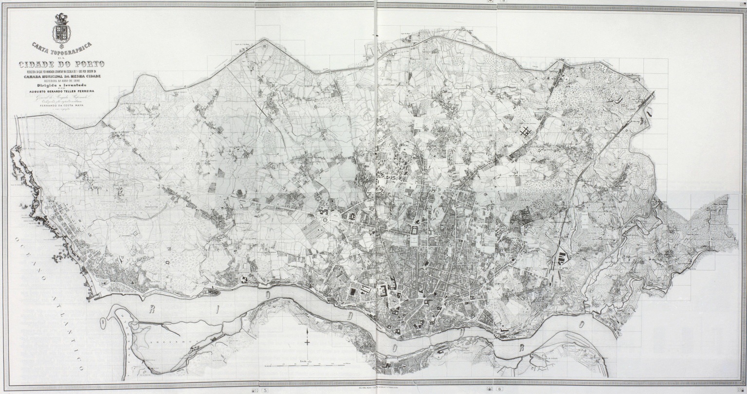
A. G. Telles Ferreira, topografische Karte der Stadt Porto, 1892.