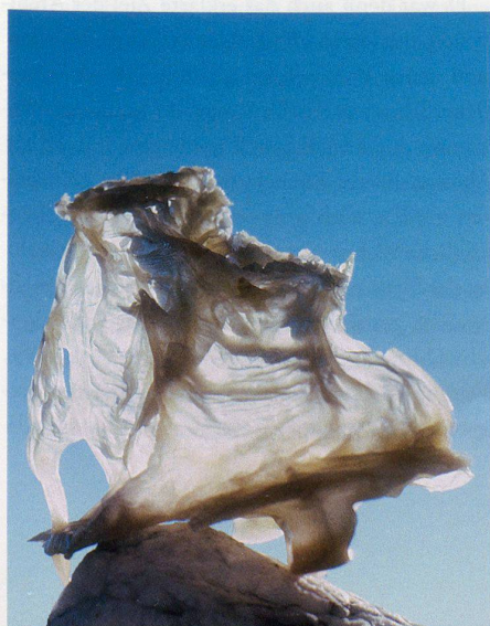
Wachsstudien zur Formfindung, 1980er Jahre, Merete Mattern

Bild: Merete Mattern / Fabian Zimmermann