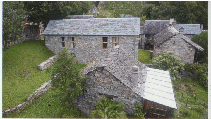
Aussicht von der Seilbahn auf die Herberge und den Weinberg im Hintergrund

deutlich sicht- und lesbar, und sie setzen sich klar ab gegenüber der unkontrolliert wuchernden Nachbargemeinde Sementina.