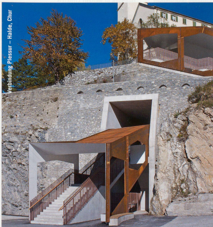
Verbindung Plessur – Halde, Chur

Unten in der Ebene, vierhundert Meter tiefer und über eine Seilbahn verbunden, liegt Monte Carasso, jene Gemeinde am Rand der Magadinoebene, die dank dem dreissigjährigen unermüdlichen Engagement von Luigi Snozzi zu einem Vorzeigebispiel für moderne Siedlungsentwicklung, Verdichtung und Baukultur wurde. Die städtebaulichen Qualitäten des 1993 mit dem Wakkerpreis und dem Prince-of-Wales-Preis der Harvard University ausgezeichneten Dorfs Monte Carasso werden gerade aus der Vogelperspektive