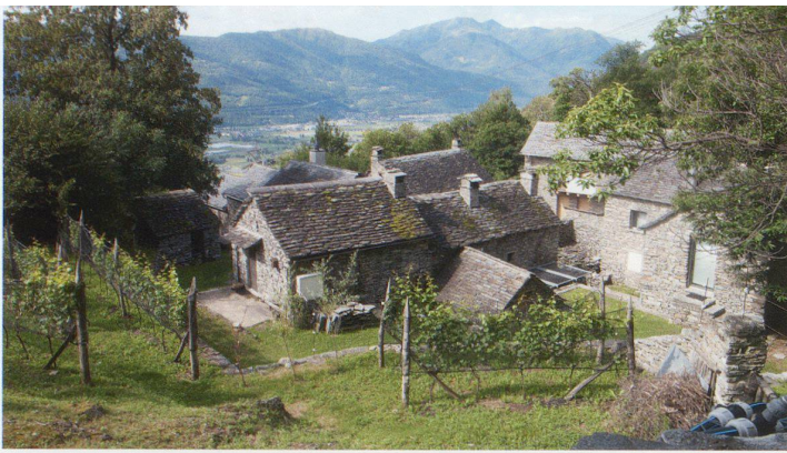
Aussicht vom Weinberg übers Ensemble auf die Magadinoebene