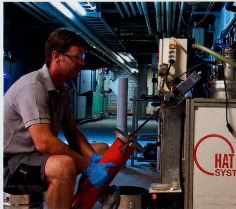
Nach dem Mischen und Dosieren wird das Beschichtungsmaterial in Kartuschen für die eigentliche Innenbeschichtung vor Ort abgefüllt.

Mit HAT-System werden Rohre, wie gesagt, von innen saniert. Zunächst wird mit Druckluft das Restwasser aus dem Heizungssystem geblasen und sauber entsorgt. Dann werden die Rohrinneflächen gereinigt: Ein Spezialkompressor presst ein von Fall zu Fall anders abgestimmtes, chemiefreies Granulat an die Rohrwände und entfernt Schlammrückstände und Verkrustungen selbst innerhalb kleinster Winkel und Ver-