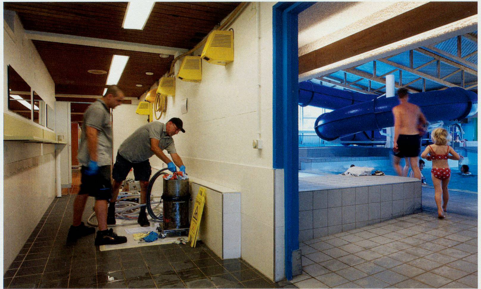
Rohrrinnensanierung mit HAT-System: Keine Baustelle. Kein Aufreissen. Kein Bauschutt. Kein Lärm. Also auch keine Betriebsunterbrechungen.

Teure Komplettsanierungen lassen sich umgehen, wenn rechtzeitig eine Zustands- und Machbarkeitsanalyse durchgeführt wird. Eine Analyse des Heizwassers, beispielsweise, liefert mit Hilfe eines mobilen Labors bereits zuverlässige Parameter vor Ort. Mit dem Einsatz einer Wärmebildkamera werden ausserdem Bodenheizungs-Rohrverlauf sowie energetische Montagemängel aufgezeigt.