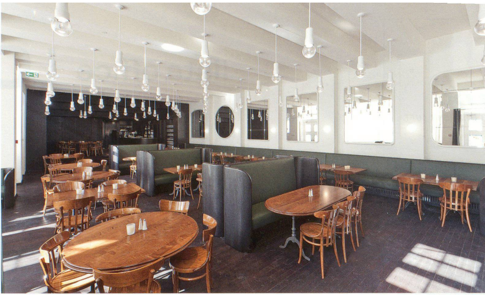
Brasserie: in der freigelegten Deckenstruktur ist jeder zweite «Balken» ein Lüftungskanal