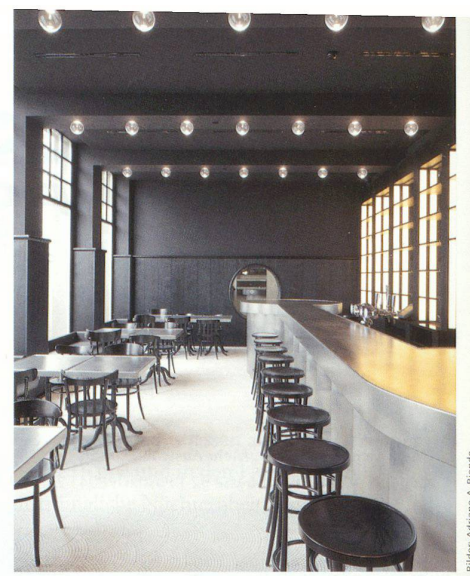
Bar: Der Tresen ist rundum mit Zink eingekleidet