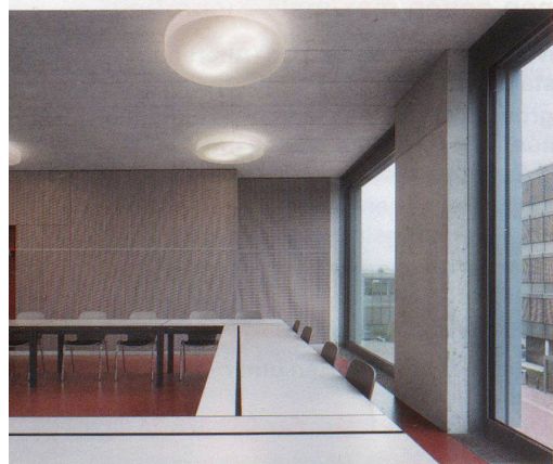
Experimentelle Farbfindung im Haus der Farbe (ganz oben), Erschliessungsbereich in der Berufsschule Lenzburg (Mitte), Schulzimmer mit rotbraunem Linoleumboden