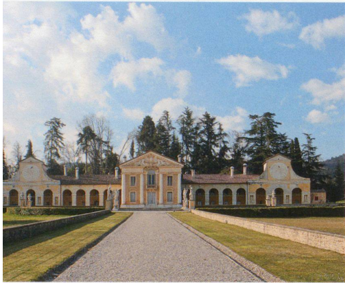
Bilder: Johann Christian Plagemann