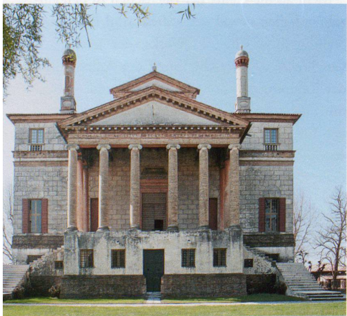
Villa Barbaro, Maser (ganz oben); Villa Thiene, Quinto Vicentino (Mitte); Villa Foscari la Malcontenta, Mira/Venedig

Hintergrund. Auch die formwirksamen Vorläufer Palladios werden abgehandelt. Das geistige Klima hingegen, auf welchem die Renaissance gründet und welches die Basis für das künstlerische Schaffen jener Epoche darstellt, bleibt mehr oder weniger ausgeklammert: Wer sich zur Idee der harmonischen Gesetze am Anfang der Welt und ihrer allgemeinen Gültigkeit Zugang verschaffen will, dem sei Rudolf Wittkowers Büchlein «Grundlagen der Architektur im Zeitalter des Humanismus» als ergänzende Lektüre empfohlen.