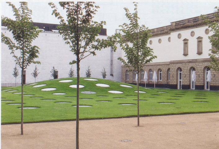
Städel-Hof mit gewölbtem Rasenteppich