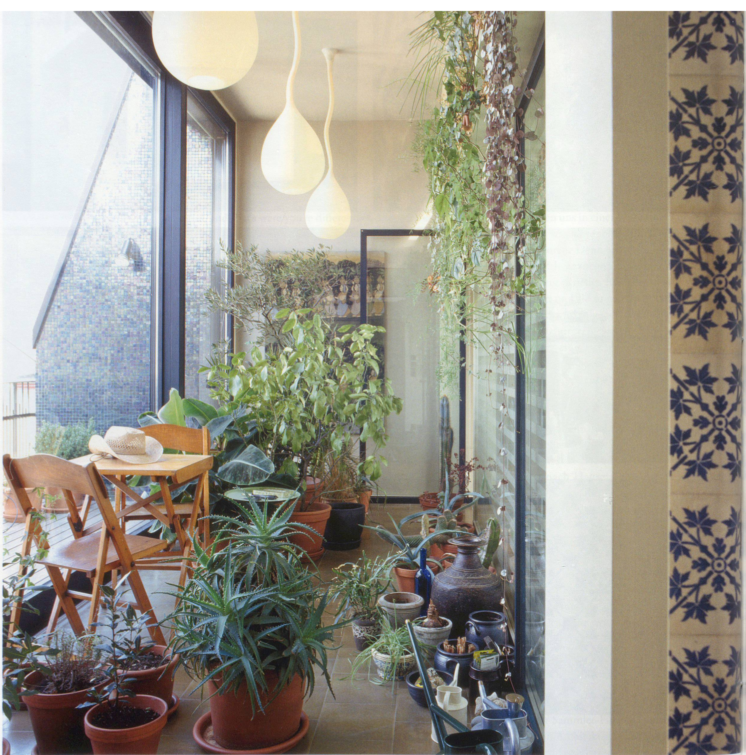
Loggia im Dachgeschoss