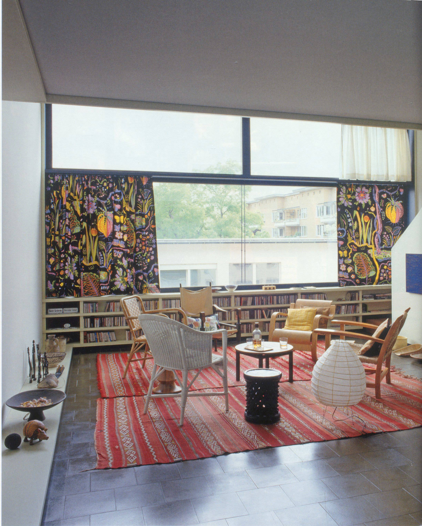
Das zweigeschossige Wohnzimmer im Eingangsgeschoss