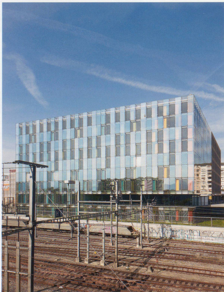
Gläserner Hofabschluss in Genf mit Paneelen in unterschiedlicher Spiegelung und Farbigkeit

Die «Internationalität» der Architektur kann nicht vom Mies'schen Traum der Fassadentransparenz getrennt werden. Der Mythos entfaltete sich bei den Modernen bis zum Symbol der internationalen Zusammenarbeit, als 1952 der Sitz der UNO in New York eingeweiht wurde. Aber die Curtain Wall, die seither von internationalen Firmen gerne in den von Hochhäusern eroberten Downtowns als Repräsentationsmerkmal eingesetzt wird, wurde in den Augen der Nachkriegskritiker schon bald zu einem grausamen Spiegel; sie deuteten deren spiegelnde Undurchsichtigkeit als Zeichen der Entfremdung von der Arbeitswelt.