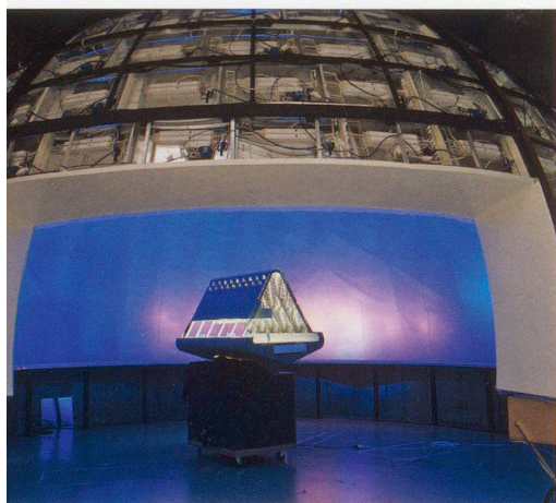
Künstlicher Himmel des Lichtlabors Bartenbach

Das Innere der Kirche widersprach bis zum eben abgeschlossenen Umbau diesem Eindruck. Es wurde mehreren, teils unglücklichen Veränderungen unterworfen, deren Resultat man bestenfalls als behäbig charakterisieren kann. Der ursprünglich längsrechteckige Versammlungsraum mit mittig vor der Ostwand angeordneter Kanzel wurde bereits in den 1930er Jahren um einen ostseitigen zweigeschossigen Anbau mit Orgel und