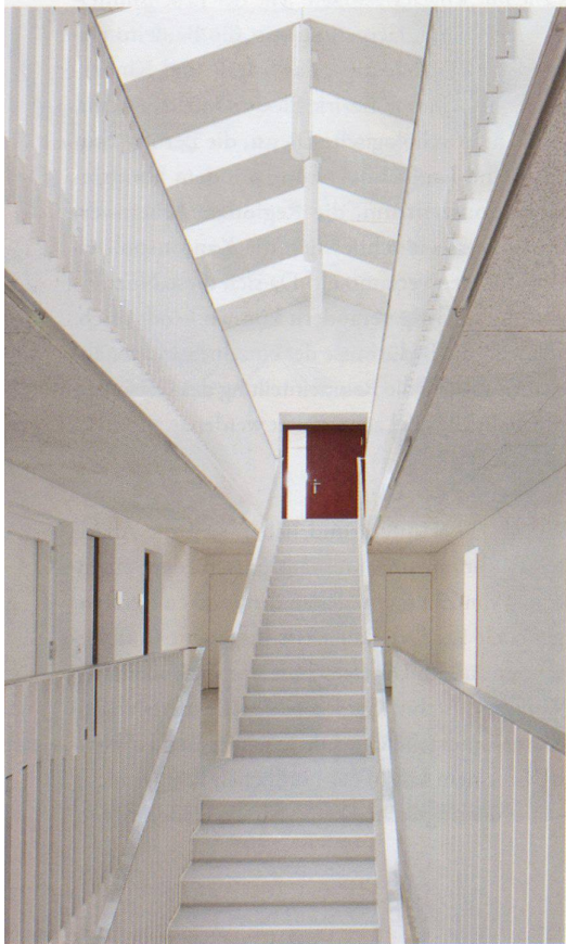
Treppenhalle mit Kaskadentreppe

Ziel des 2007 ausgeschriebenen Wettbewerbs für die Erweiterung des Gemeindehauses war in erster Linie, den gesteigerten Raumbedarf der Gemeindeverwaltung abzudecken. Des Weiteren sollten die auf verschiedene Standorte verteilten Mitarbeiter möglichst am selben Ort zusammenarbeiten. Phalt Architekten aus Zürich gewannen den Wettbewerb mit einem organisatorisch klaren und städtebaulich überzeugenden Projekt. Der 2011 eingeweihte Erweiterungsbau legt sich längs zur Watterstrasse zwischen Bahnhof und alten Dorfkern. Zwischen dem winkelförmigen, innenräumlich optimierten und sanierten Gemeindehaus-Altbau und dem Neubau spannt sich ein neuer Platz auf, der für öffentliche Anlässe genutzt wird. Organisatorisch funktionieren Neu und Alt als Einheit. Formal grenzt sich das schlichte Gebäude vom Bestand ab. Der kompakte Baukörper reagiert an seinen Ecken auf die