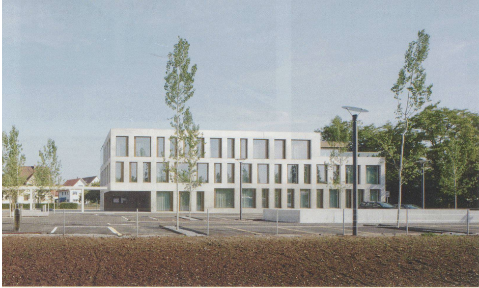
Ergänzender Solitär ohne bestimmende Hierarchien

örtlichen und funktionalen Gegebenheiten: zum Platz hin bildet die eingeschnittene Ecke im Erdgeschoss ein Vordach für den Haupteingang; die diagonal gegenüberliegende Ecke ist entsprechend für den Personaleingang und das Fluchttreppenhaus ausgeschnitten. Im obersten Geschoss des zweigeschossigen Gebäudes wiederholt sich dieses Prinzip spiegelverkehrt. Zur Strasse hin öffnet sich der Raum mit einer übereck geschosshohen Verglasung und bietet damit einen Panorama-Ausblick auf die Umgebung. Das gläserne Eck bildet den krönenden Raumabschluss für die ellipsenförmige, frei im rechteckigen Raum stehende Haupttreppe. Der quer gegenüberliegende Gebäude-Einschnitt ist wiederum ein Aussenbereich und als Terrassenplatz für die Angestellten der Teeküche vorgelagert.