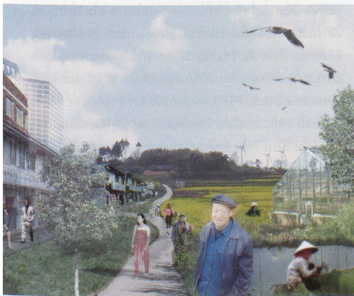
Scharfe Gegensätze zwischen Stadt und Land

Und das alles basiert auf den bestehenden Strukturen?