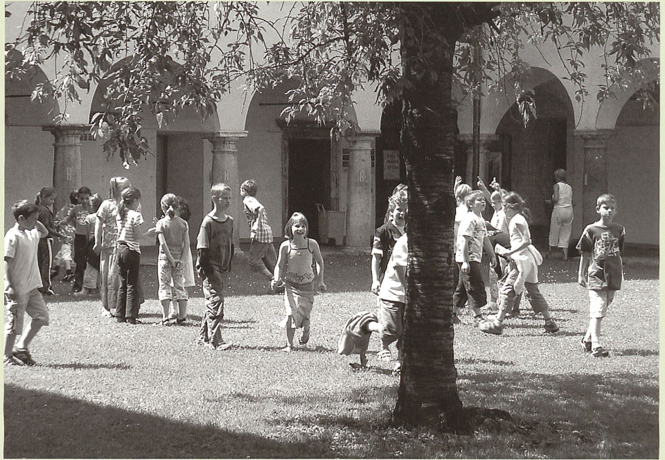
Kreuzgang des Minoritenklosters in Graz (1607).

Und doch ist dies leider noch viel zu häufig der Fall. Ersatzneubau lässt sich sehr selten mit primär ökologischen Argumenten rechtfertigen. Erst in Kombination mit baulichen, funktionalen oder wirtschaftlichen Defiziten fällt der Entscheid für den Abbruch. Wenn der Bestand aber heutige Anforderungen erfüllen kann, dann sollen wir ihn erhalten, unterhalten und uns daran freuen.