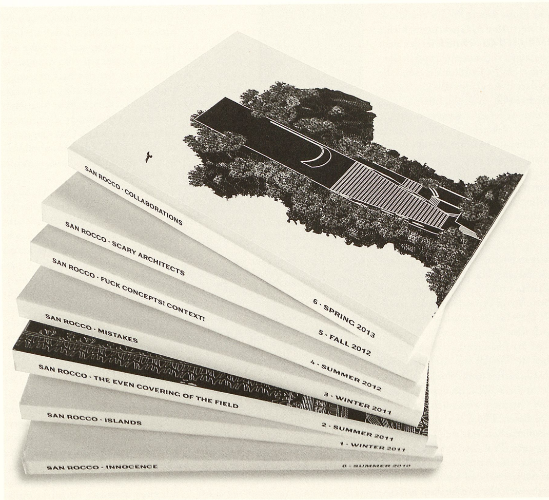
Schwarze Vignette auf neutral weissem Hintergrund: In jeder Ausgabe von «San Rocco» kristallisieren sich Erzählungen der Architektur um ein Thema.