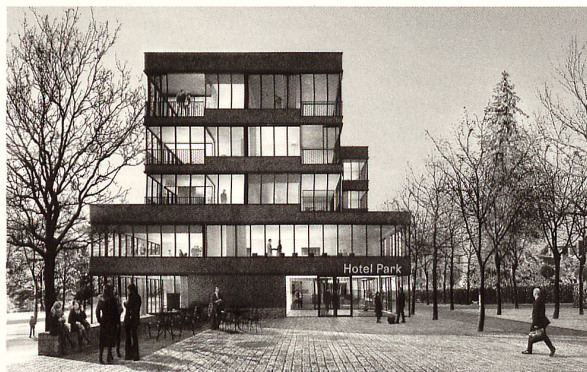
4. Preis Armon Semadeni Architekten. Fassadenbänder wie in den 1960er Jahren

Projektkonomie konsequent weiter. Aber die Zimmer sind geschickt angeordnet und eingerichtet. Die grossen nutzen die Ecken, und kleine kluge Massnahmen schaffen einen Mehrwert und somit Distanz zum Üblichen im Dreiternebereich: Ein Lichtschlitz in der Dusche, Loggien an den Stirnseiten für die grossen Zimmer. Die Konzentration im Erdgeschoss lässt einen Betrieb mit wenig Personalaufwand erwarten. Im Vergleich zum Sieger bietet der zweitranzierte Beitrag von Raumfindung Architekten eine Anordnung der Zimmer längs zur Fassade und ein Feuerwerk an Raumerfindung auf dem Weg dahin. Doch für wen eigentlich? In Heiden locken doch Aussicht, Seminarprogramm oder die nächste Busfahrt. Ein aufgeräumtes und gut gestaltetes Erdgeschoss richtet da nicht viel aus.