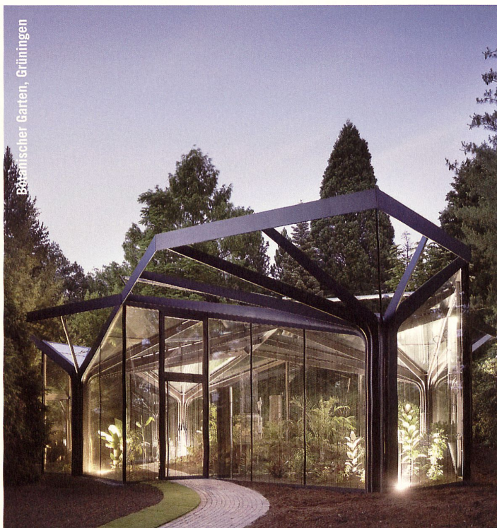
Behäuslicher Garten, Grünigen

29.8. Zürich, Bund Schweizer Archi- tekten BSA, Ortsgruppe Zürich Autonome Architektur Aldo Rossi in Zürich, Begegnung mit Zeitzeugen Kontakt: p.wappel@agps.ch