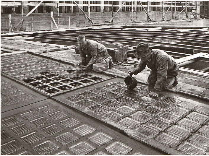
Glasbaustein früher: Für die Oberlichtverglasung der grossen Halle im Maschinenlaboratorium der ETH Zürich wurden die Glasbausteine einzeln in ein Stahlgitter eingelegt, verfugt und mit Blei vergossen.