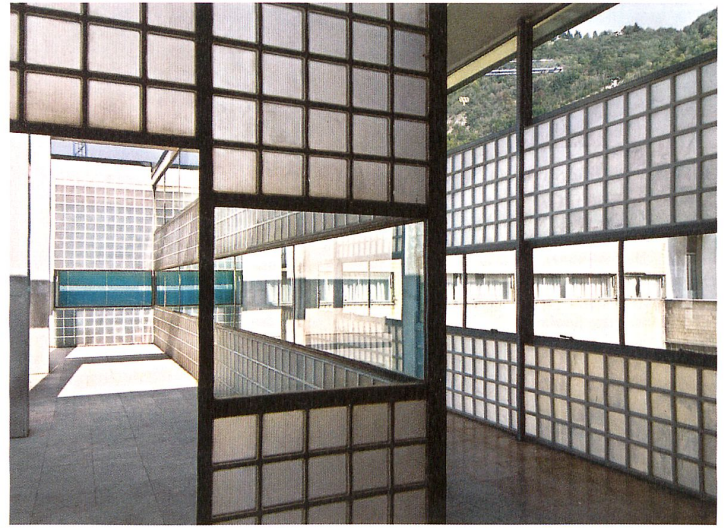
Giuseppe Terragni setzte im Innern der Casa del Fascio in Como Glas in verschiedenen Formen ein, um die Transparenz, die Transluzenz, die Brillanz, aber auch die Geometrie zu feiern. Im Wechsel mit Klarglассscheiben bilden Glasbausteine Wände