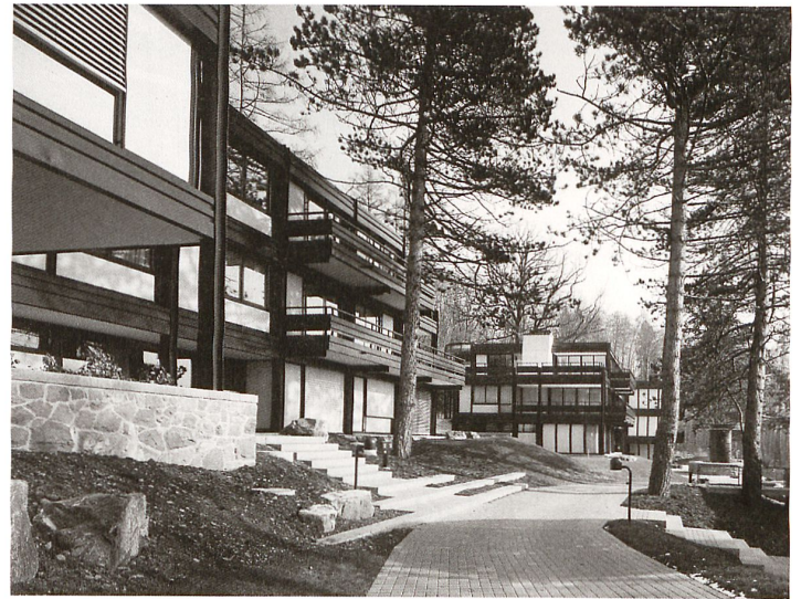
Mies'sche Eleganz am Waldrand: Wohnüberbauung Dolderpark von Marcel Thoenen, 1979