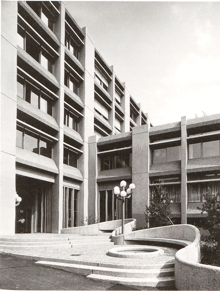
Farbenfrohe Elementbauweise: Berufsschule für den Detailhandel in Zürich-Unterstrass von Rudolf und Esther Guyer 1973