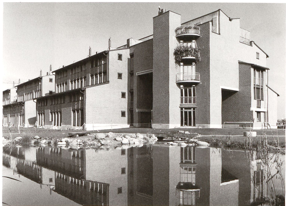
Nach Venturi – Sichtbackstein und dunkles Holz: Wohnheim der Stiftung Altried in Zürich- Schwamendingen von Werner Egli 1982