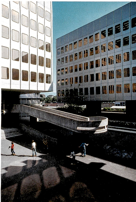
Vorhangfassaden und schwebende Volumen: Städtisches Verwaltungszentrum Chauderon von AAA – Atelier des Architectes Associés, 1969–1974

Im Kanton Waadt ist eine Aktualisierung des Denkmalpflege-Inventars vorgesehen. Die Publikation «Architecture du Canton de Vaud 1920–1975» von Bruno Marchand (2012) bietet dazu die wissenschaftliche Grundlage.