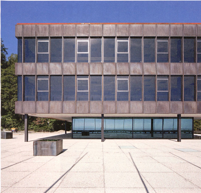
Die eidgenössische Sportschule in Magglingen von Max Schlup (1970, links) figuriert im Inventar: Die Bieler Spaceshop Architekten haben das Hauptgebäude 2002–10 vorbildlich erneuert.