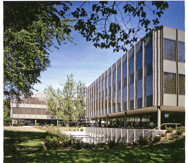
Das Gymnasium Strandboden in Biel (unten) vom gleichen Architekten (1979) dagegen wird vom Kanton Bern tiefgreifend erneuert, weil es noch nicht als «schutzwürdig» inventarisiert war.