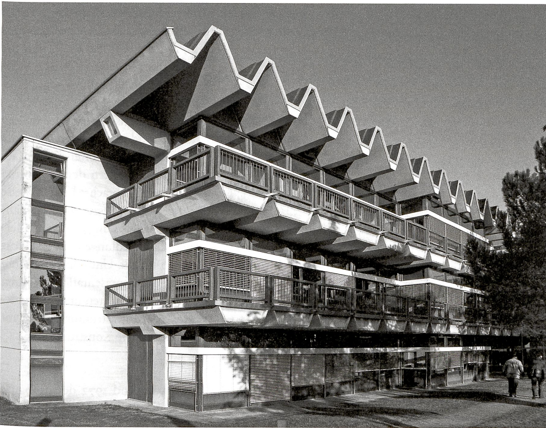
Centre de recherche agricole in Changins von Heidi und Peter Wenger 1974

Im Kanton Waadt ist eine Aktualisierung des Denkmalpflege-Inventars vorgesehen. Die Publikation «Architecture du Canton de Vaud 1920–1975» von Bruno Marchand (2012) bietet dazu die wissenschaftliche Grundlage.