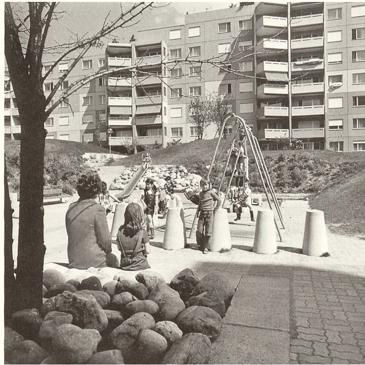
Kinderparadies in der Wohnsiedlung Sonnhalde Adikon 1972