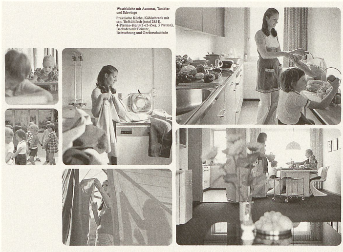
Das Daheim der «grünen Witwen». Bildergeschichte aus einem Werbeprospekt der Firma Göhner für die Siedlung Webersmühle in Neuenhof 1974

gen Beschaffung von Bauland bis zur raffinierten Planung der Kranbahnen und der Einrichtung der Lastfahrzeuge reichte, damit die Bauelemente ohne Schwertransport-Kosten transportiert werden konnten. Alle diese scheinbaren Nebensachen hatten Rückwirkungen auf die Konstruktion der einzelnen Elemente. Alle Vorgänge mussten ineinander spielen und so konzipiert sein, dass sie in summa gegenüber konventionellem Bau einen Kostenvorteil von rund 20 Prozent brachten – ein Vorteil, von dem der Löwenanteil an die Endnutzer, ob Mieter oder Wohneigentümer, weitergegeben wurde.