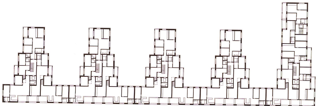
1. und 3. Regelgeschoss