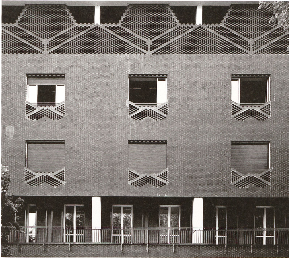
Schauffassade an der Via Sambuco. Im Dachgeschoss befinden sich die Zellen der Nonnen mit einer gemeinsamen Loggia hinter dem halbtransparenten Hohlziegelvorhang. Bild: Vincenzo Martegani