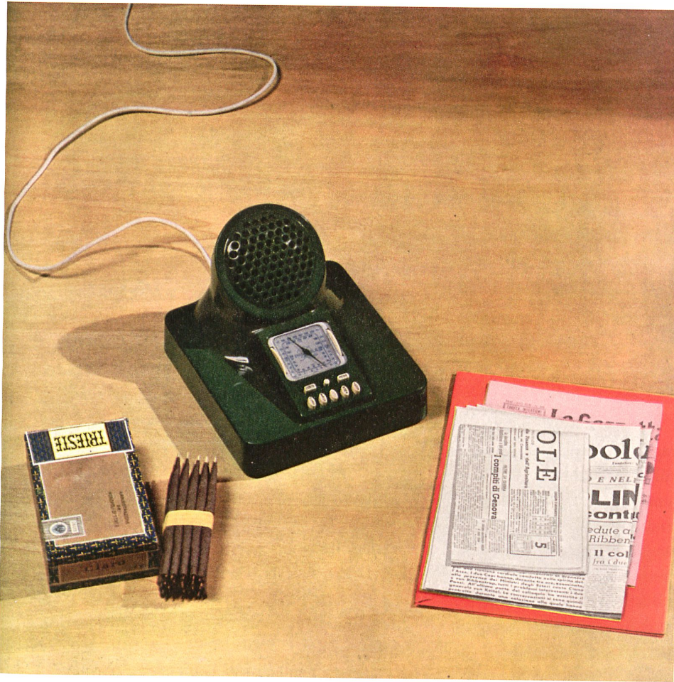
Luigi Caccia Dominioni, Livio und Pier Giacomo Castiglioni: Radioapparat Phonola 547, 1940. Grundfläche 24 x 24 cm, einteiliges Phenolharzgehäuse über Metallchassis. Der Artikel in Domus war überschrieben mit «Priorità italiana nello stile dell'apparecchio radio».