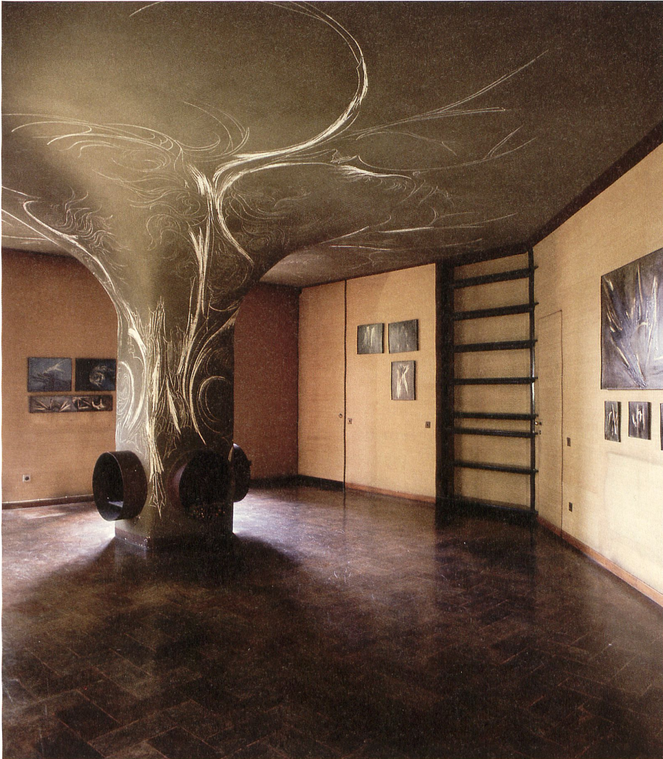
Francesco Somaini, Kamin in der Wohnung von Luisa Bettoni Somaini, 1962, Sgraffito.