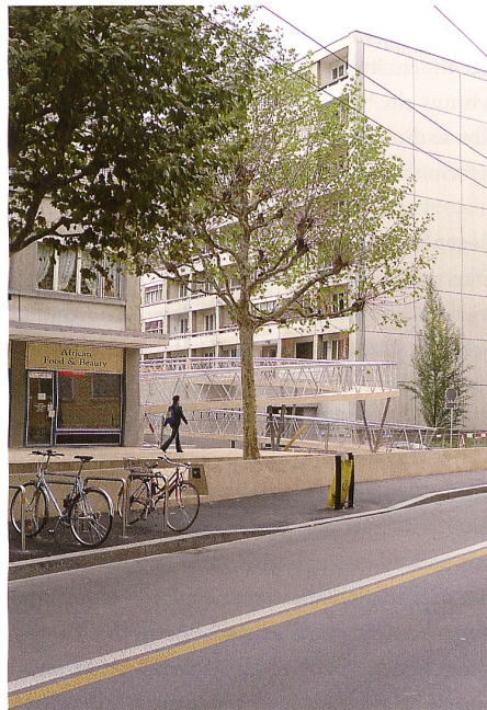
Passerelle zum oberen Niveau der Cité-Jonction

Adresse: Rue du Vélodrome, 1205 Genf Bauherrschaft: Stadt Genf Architektur: Pascal Heyraud, Landschaftsarchitekt (Projektleiterin: Giulia Vanni), Neuchâtel; Raphaël Nussbaumer und Frédéric Perone, Architekten, Genf Fachplaner: Ingenieurbüro Michel Buffo und Thomas Jundt, Genf Termine: Wettbewerb: 2008, Realisation erste Etappe: 2011–12, zweite Etappe: 2013–15