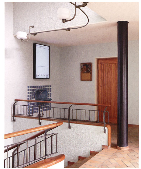
In der Eingangshalle kommt die ursprüngliche Farb- und Materialpalette wieder zum Tragen.