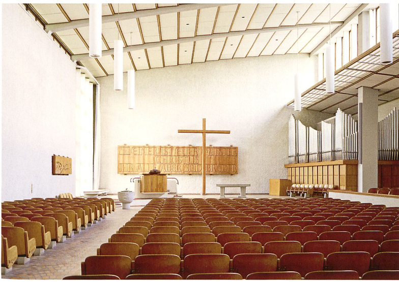
Die gereinigten Oberflächen des Kirchenraums reflektieren wie ehemals das diffuse Nordostlicht.