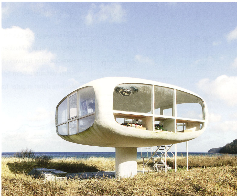
Der Rettungsturm der Strandwache Ostseebad Binz von 1981 des DDR-Schalenbaupioniers Ulrich Müther wird heute als Standesamt genutzt.

forms of pavilion Although they represent one of the classic tasks of architecture, pavilions are not easily defined. At first glance, everything appears perfectly clear. A pavilion is small, stands alone and is lightly built, as its predecessors are various forms of tent and it shares with them a tendency to vanish. But the term is far wider than this. And consequently the pavilion includes more than just the image of the primitive hut which was domesticated to make a garden folly out of the cabin in the woods. The pavilion is found as an infrastructure building on traffic islands, is reproduced as urban furniture or, in the shape of a snack stand, occupies vacant sites in the urban fabric. The French word for butterfly, papillon, already suggests the quality of a temporary diversion. The pavilion's flighty character enables it to enjoy a higher level of acceptance and autonomy. Since the Paris world exhibition in 1867 the pavilion has become an established form of exhibition building. Pavilions are prototypes of the new, used for testing new constructions or spatial principles. They are toys for young architects or serve as manifestos for the grand old men or women of the profession. The butterfly motif itself refers to the re-use, pupal transformation or further flight of a pavilion. ■