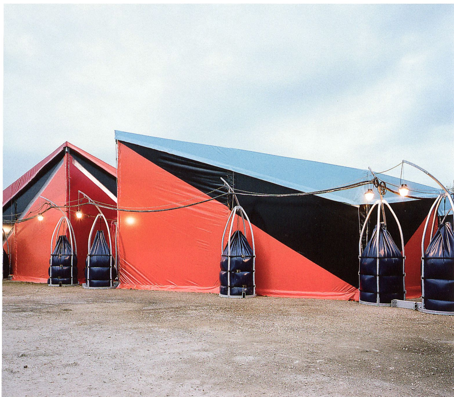
Das «Centre Pompidou mobile» von Patrick Bouchain mit Loïc Julienne landete bis zum Januar 2012 in Chaumont im ländlichen Nordosten Frankreichs.

hüllt, wie bei der Festhütte in Amriswil (vgl. wbu 5|2008) von Müller Sigrist Architekten. Beim «Centre Pompidou mobile» haben Patrick Bouchain und Loïc Julienne genau dieses Versprechen in eine Wanderausstellung in Zeltform umgemünzt. Die Ausstellung zeigt nur vierzehn Werke der Pariser Kulturmaschine, dafür sollten selbst Kleinstädte in den Genuss zeitgenössischer Kunst kommen. Die Nagelprobe dieser romantischen Idee – die Schwellen zur Kultur abzubauen – stellen die Nutzungsanforderungen wie Klimatisierung und Sicherheit dar. Sie lassen so manchen Kunst-Pavillon wie ein überdimensioniertes Lüftungsaggregat aussehen.