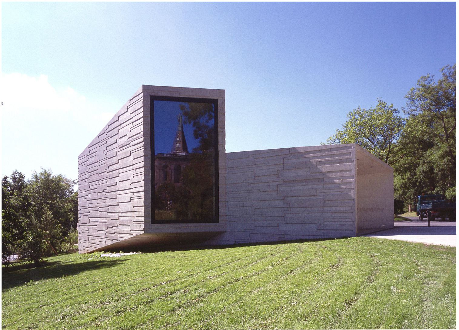
Das Besucherzentrum am Herkules in Kassel von Staab Architekten Berlin dient seit 2011 als Wahrnehmungsapparat des Bergparks.