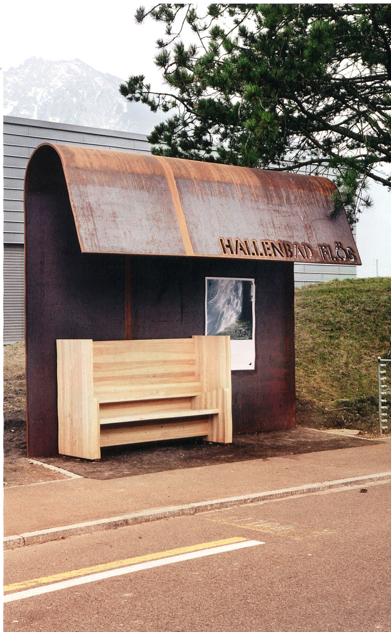
Unterstände in Pfäfers und Buchs/SG der Architekten Barão-Hutter markieren seit 2012 den Auftakt für neue Bus-Wartehäuschen. – Bild: luxwerk

Das aufgeschlagene Zelt, das an einen Schmetterlingsflügel erinnert, bildet durch die Leichtigkeit seiner Konstruktion ein wiederkehrendes Motiv für den Pavillon. Die grösste Spannung baut sich jedoch auf, wenn sich eine öffentliche Nutzung im Anschein des Monumentalen in den Zelt-Mantel des Temporären