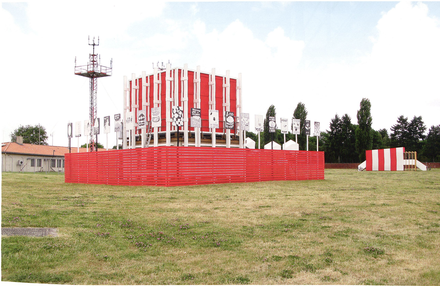
Der «Pavillon der Weltausstellungen» des Berliners Erik Göngrich und im Hintergrund der Pavillon mit Arbeiten des Filmemachers Harun Farockis sind Teil der «Grossen Weltausstellung 2012» von raumlaborberlin und dem Theater Hebbel am Ufer auf dem ehemaligen Flughafen Tempelhof Berlin.