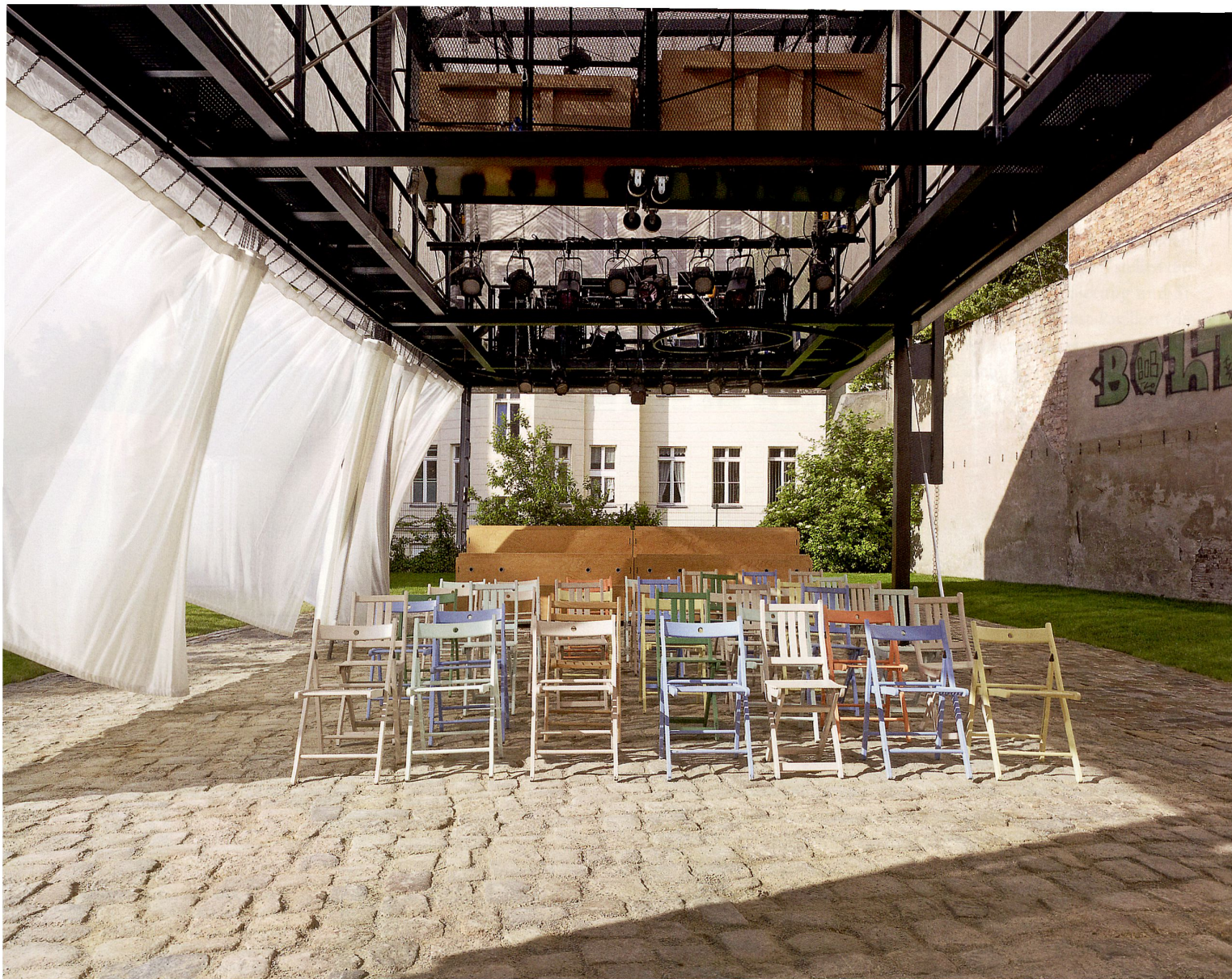
Im Sommer 2012 landete der Pavillon des BMW Guggenheim Labs, entworfen vom Tokioter Atelier Bow-Wow, auf dem Berliner Pfefferberg.

13 Seit dem Jahr 2000 beauftragt die Serpentine Gallery alljährlich ein bekanntes Architekturbüro, das noch nie in Grossbritannien gebaut hat, im Kensington Gardens von London einen Pavillon zu erstellen. Hartnäckig sich haltende Gerüchte erzählen vom gemeinsamen Ruhestand aller Pavillons auf einer einsamen Insel.