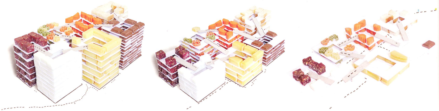
Konzeptdarstellung: Ein Pavillon, der verschwindet