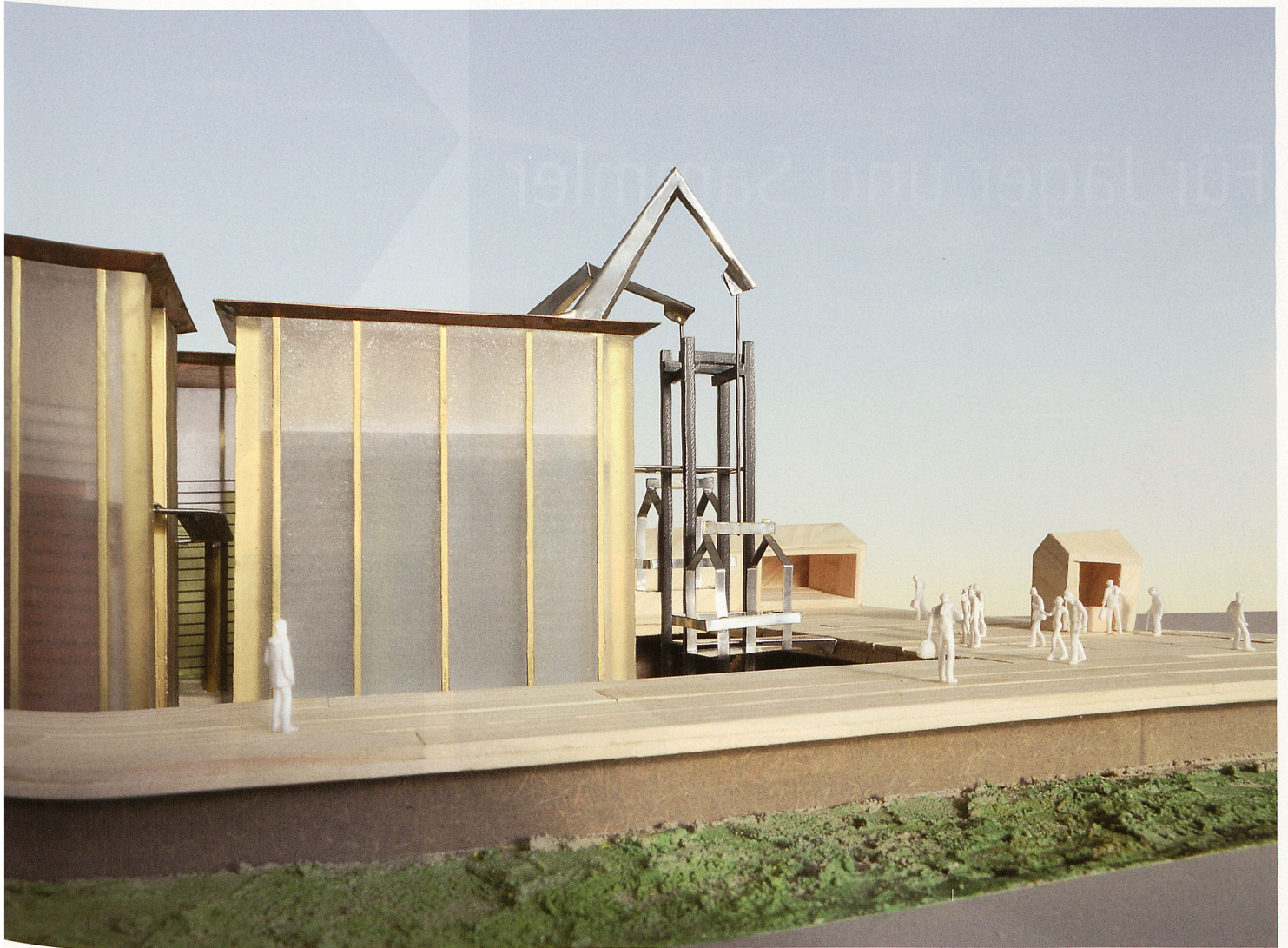
Lifte befördern die Besucher zu den gefüllten Regalen

werden. Von der Plattform aus führen Lifte in die luftigen Höhen der obersten Turmetagen. Hier können sich die Besucher frei mit den gelagerten Produkten eindecken. Je nach Füllstand der Hochregallager führt der Konsumparcours über horizontale, auf- oder absteigende Passerellen von einem Turm zum anderen.