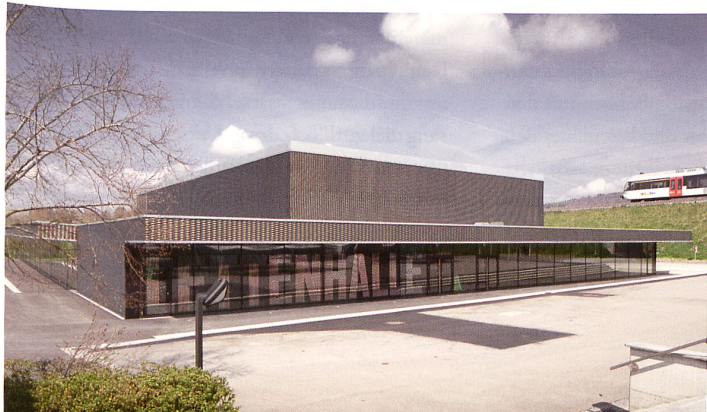
Die Halle mit «Fell» aus grossmaschigem Streckmetall