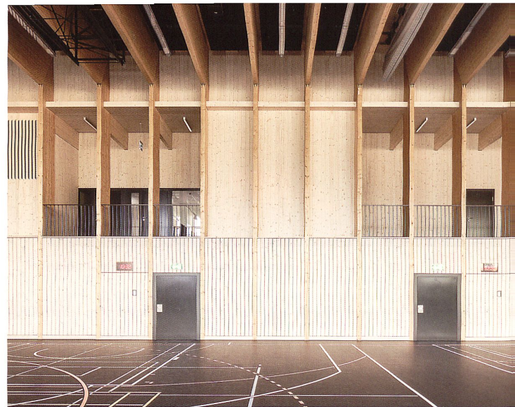
Die filigrane Tragstruktur mit parallelen Zweigelenrahmen gliedert die Innenräume

einander verschobene Segmente. Diese Differenzierung wird innerhalb der drei Fassadensegmente jeweils durch die Verbreiterung der Fugenabstände zwischen den Lamellen bei gleichzeitiger Verkleinerung der Lamellenbreite verstärkt. Grosse Öffnungen im Norden versorgen die vier Sporthallen mit konstantem Tageslicht. Gegen Süden gewährt ein Lamellenvorhang eine ausreichende Belichtung und sorgt gleichzeitig für einen guten Sicht- und Sonnenschutz der dahinter liegenden Innenräume. An den beiden Querseiten des Sportzentrums steigen die Metallbänder leicht diagonal an: durch das kompositorische Element der Diagonale wird eine geometrische Spannung in der Fassade erzeugt.