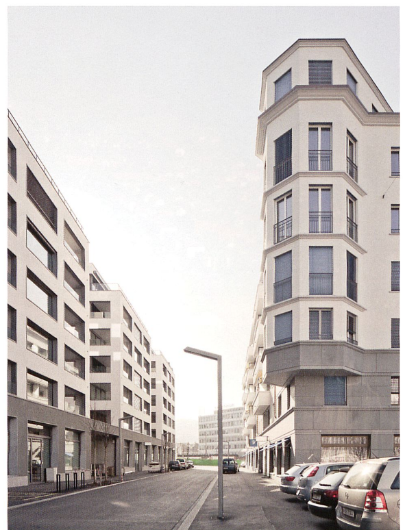
Strassenraum zwischen den Bauten von Adolf Krischanitz (links) und Hans Kollhoff (rechts); Blick vom zentralen «Rapid-Park» in Richtung Bahnlinie