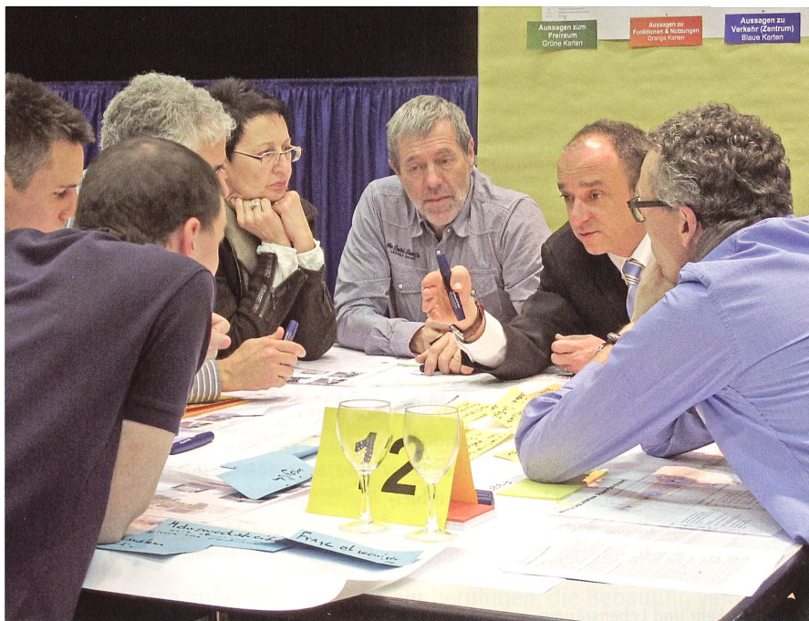
Bürgerinnen und Bürger im Dialog.

Grosses» entstehen könne. Einige Teilnehmende forderten, dass das Thema einer verkehrsfreien Fussgängerzone, einer teilweisen Einbahnstrasse oder zumindest die Einrichtung einer Tempo-30-Zone im mittleren Abschnitt der Landstrasse noch einmal aufgegriffen werde.