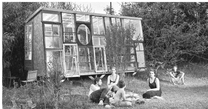
Der Pavillon «La Fabrique» der Genfer Architekten von Bureau A.

Hundert Jahre später, da rund um die Welt in Windeseile vollklimatisierte Sitze von Firmenimperien hochgezogen werden, verraten seine Worte einen beunruhigenden Weitblick. — Daniel Rosbottom Übersetzung: Christoph Badertscher