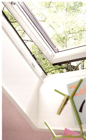
Roto Dach- und Solartechnologie GmbH Bernstrasse 390, CH-8953 Dietikon T +41 44 267 47 47 www.roto-dachfenster.ch

RotoComfort i8 ist das erste Klapp-Schwingfenster mit einem elektrischen und automatischen Bedienungssystem, welches im Blendrahmen integriert ist. Per Schalter, Handsender oder auch Smartphone und Tablet bedienbar, bietet das neuartige Dachfenster nach Angaben des Herstellers «Komfort auf Knopfdruck» und freien Ausblick ganz ohne störende sichtbare Antriebselemente. Möglich machen das in die Konstruktion integrierte Spindelantriebe, die das vollständige Öffnen des Flügels nach aussen gewährleisten und somit grösstmögliche Bewegungsfreiheit bieten.