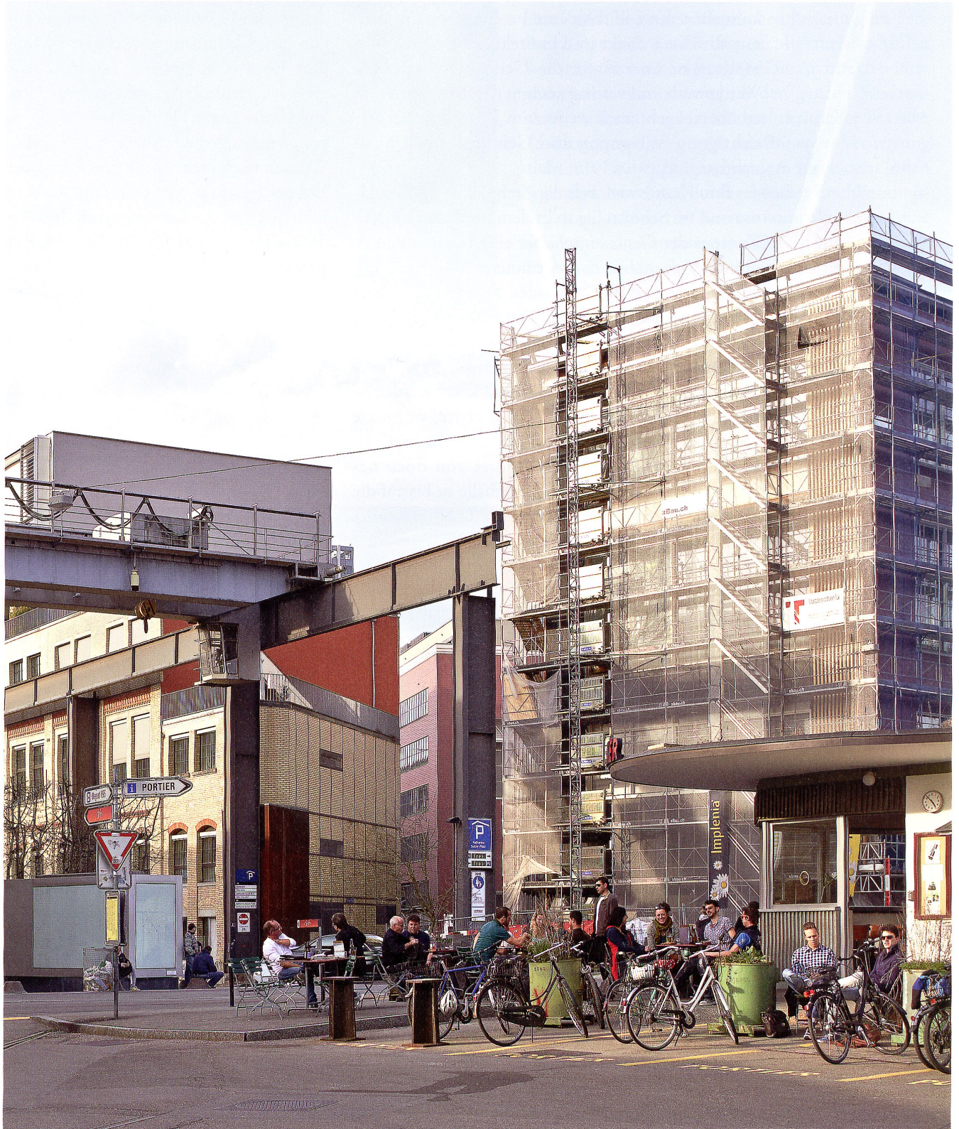
Beim Restaurant «Portier» am Eingang zum Lagerplatz kommt alles zusammen: Die Weite des Katharina-Sulzer-Platzes (links) und die engen Gassen beim neuen «Superblock», Studierende und Büroangestellte, Velos und Kinderwagen.