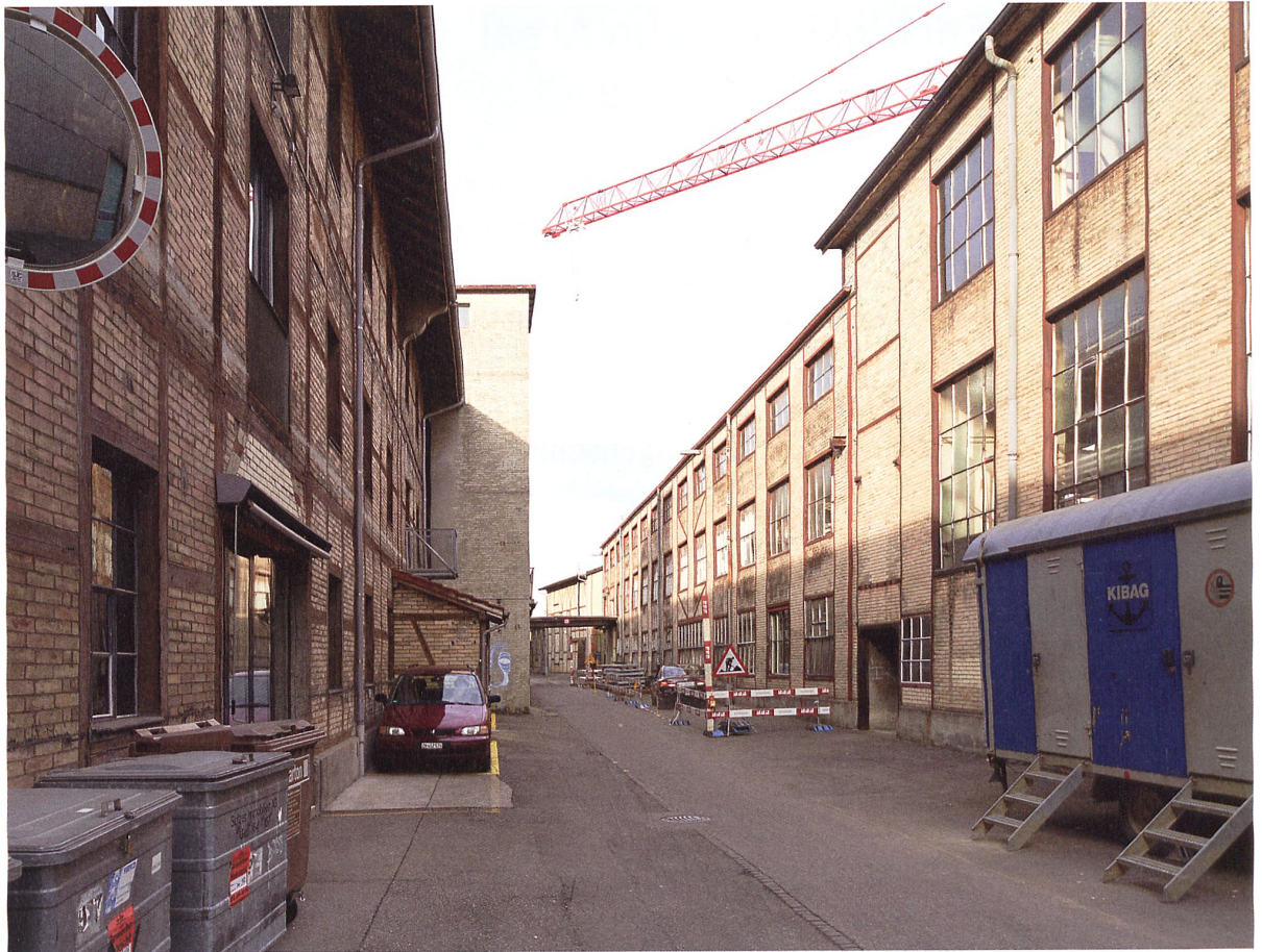
Gassenraum im Areal Lagerplatz. Hier bleiben alle bestehenden Bauten stehen und werden schrittweise instandgesetzt.