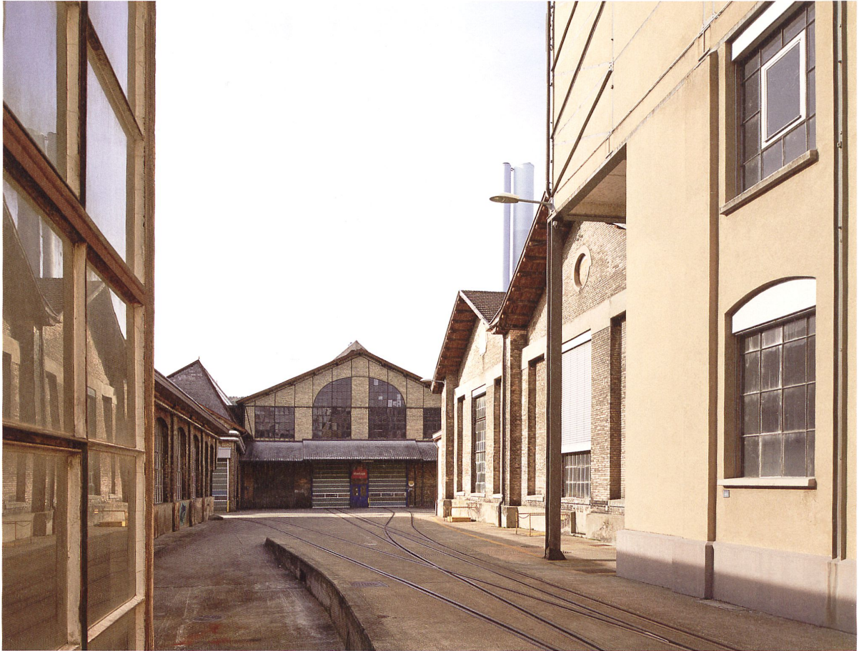
Das «Werk 1» vor der Neuüberbauung im Rahmen des Gestaltungsplans. Die zentrale Montagehalle ist geschützt, darum herum entsteht Neues.