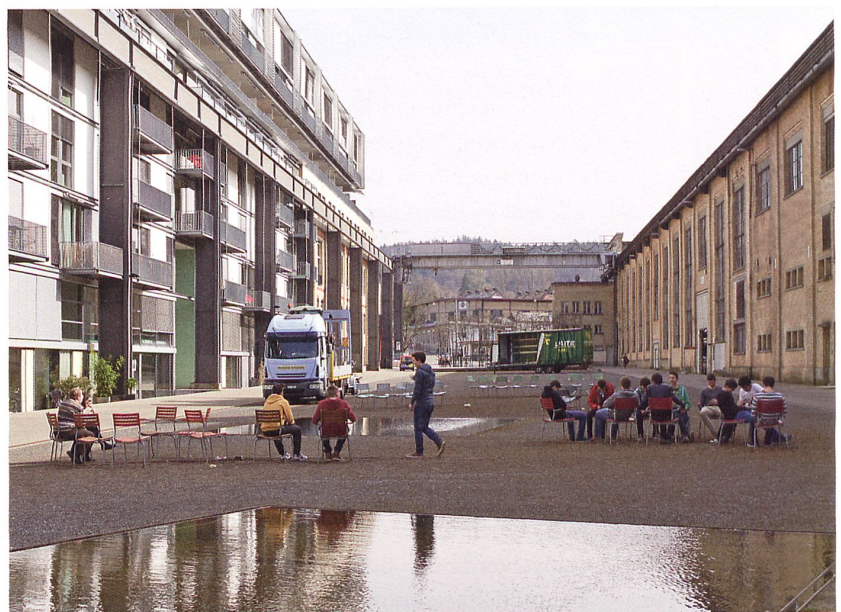
Asphalt, Stahl und Backstein: Der Materialkanon der Industrie prägt den Katharina Sulzer-Platz mit der Wohnüberbauung «Kranbahn» (links) und den Hallen 52/53 (rechts).