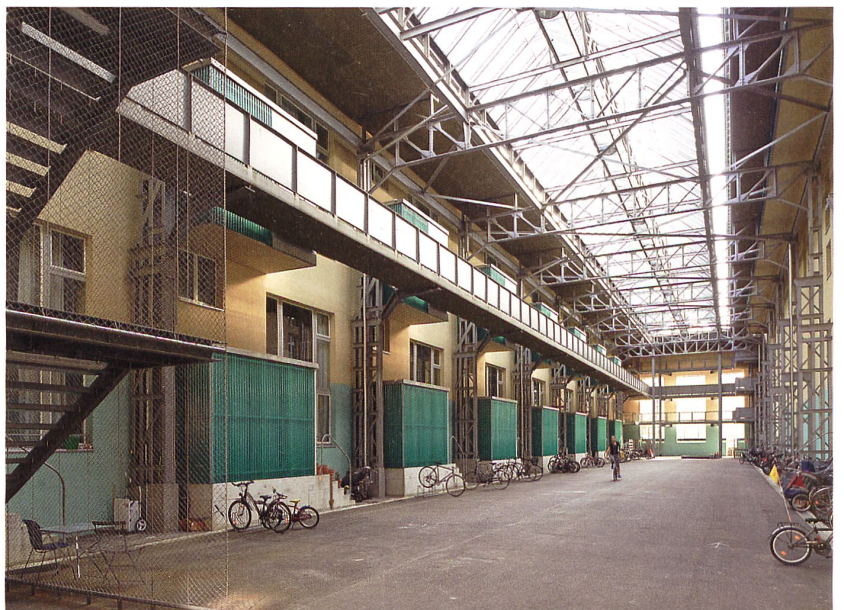
Die Wohnüberbauung «Lokomotive» von Fickert & Knapkiewicz macht aus der bestehenden Industriehalle einen gedeckten Aussenraum für die Maisonettewohnungen.