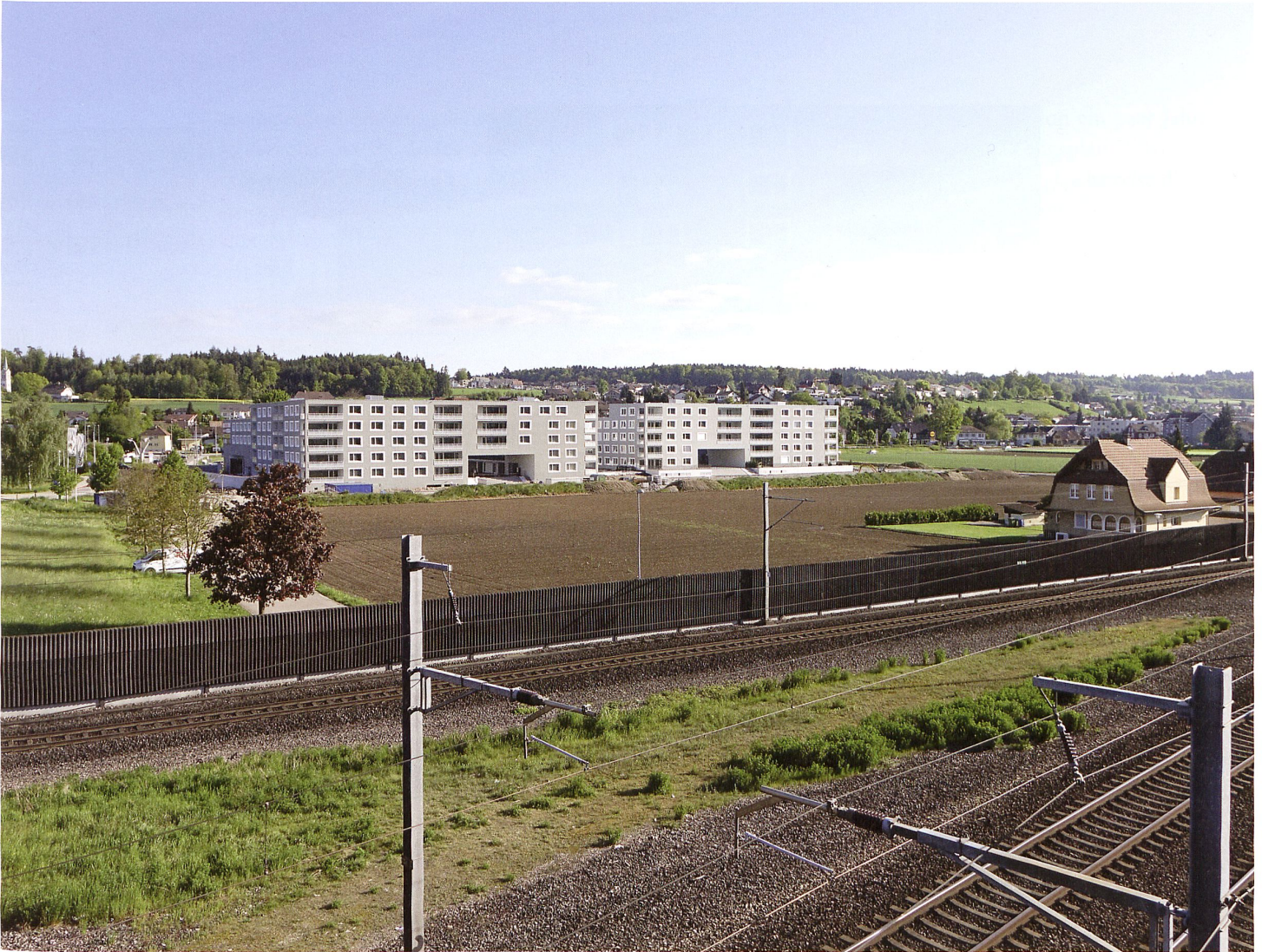
Städtische Dichte inmitten grüner Wiesen: Die ersten Neubauten im Quartier «Breitenpark» sind Blockrandtypen und zeigen zum künftigen Park fünf Geschosse.