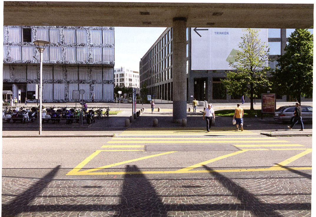
Der Eingang zum Richti-Areal vom Einkaufszentrum Glatt, links das Hochhaus von Wiel Arets und rechts der Bürobau von Max Dudler. Läden und Atmosphäre profitieren von der günstigen Passantenlage zwischen Bahnhof und Mall.