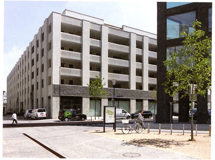
Blick von Süden in Richtung Hauptplatz. Links die Fassade des Hochhauses von Wiel Arets auf Baufeld 7, dahinter dessen Block auf Baufeld 1. Rechts das Büro-Geviert von Max Dudler auf Baufeld 6 (Bild links).