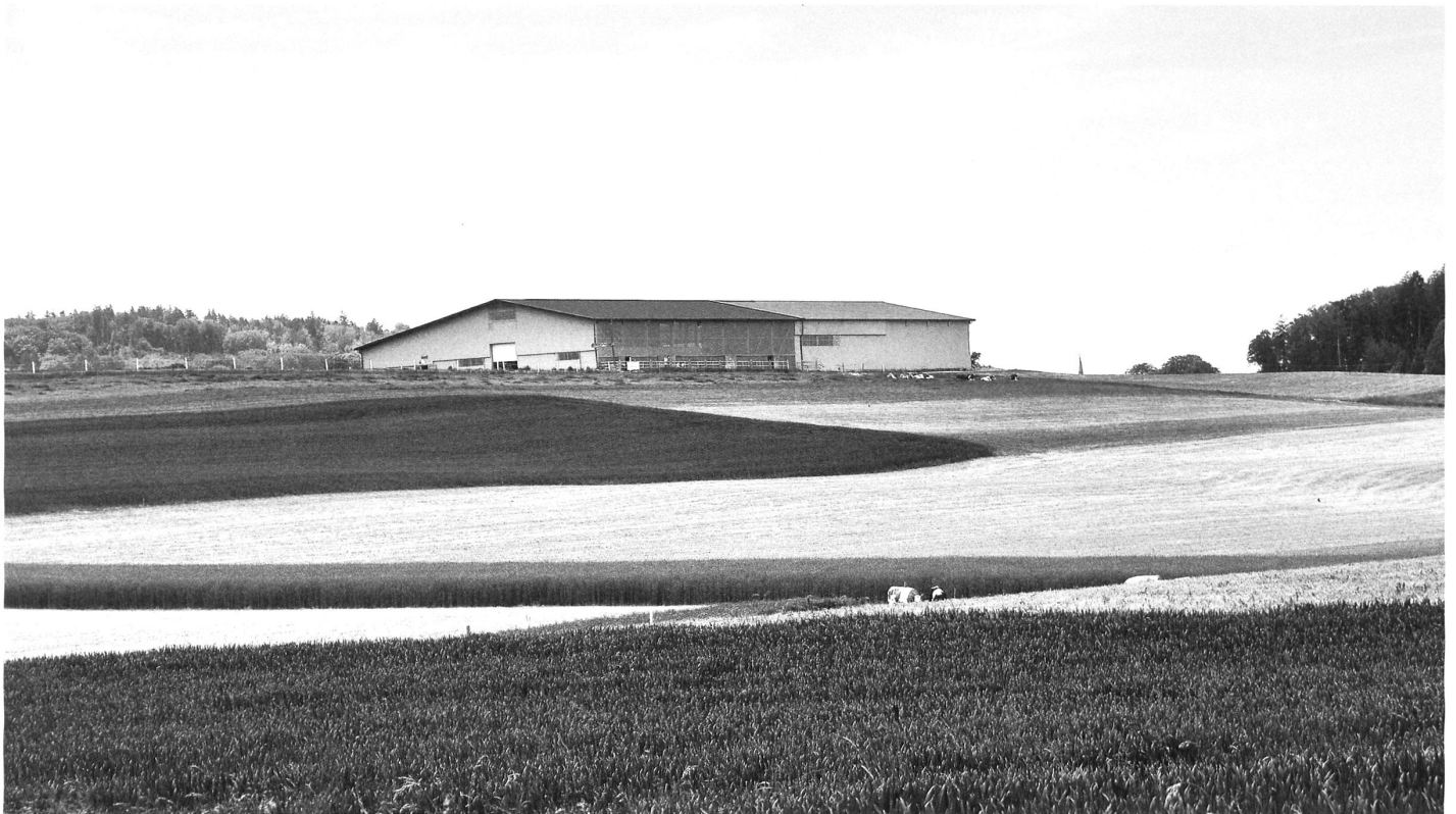
Pferdehaltung und Sonnenkollektoren sind in der Raumplanungsverordnung geregelt, die Verträglichkeit grosser Stallbauten mit der Landschaft aber nicht: Landwirtschaftliches Ökonomiegebäude im Kanton Fribourg.

Der Einfluss von kurzfristigen Einzelinteressen prägt die Verordnung zur Umsetzung des neuen Raumplanungsgesetzes, welches das Schweizer Stimmvolk im März 2013 mit deutlichem Mehr angenommen hatte (vgl. wbw 7/8–2104). Kein Wunder, denn Expertenverbände wie der SIA hielten sich ganz aus dem dornigen Prozess der Lobbyarbeit heraus.