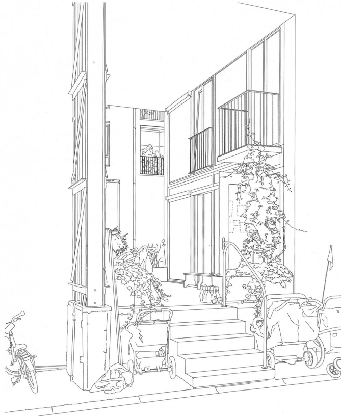
Die Zeichnungen kartieren sogar die Spuren des Gebrauchs, wie hier in der Siedlung Lokomotive Winterthur von Knapkiewicz & Fickert. Zeichnung: Doris Zoller und Team