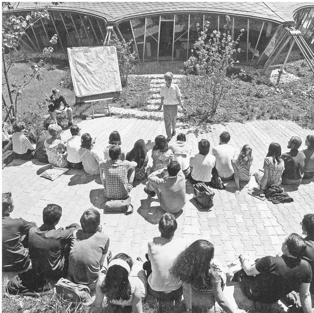
Frei Otto im Kreise seiner Studierenden am Institut für Leichte Flächentragwerke in Stuttgart; im Hintergrund das von ihm konstruierte Institutsgebäude.