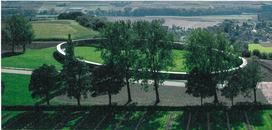
Das Memorial als geschlossener Raum des Gedenkens

geben den Blick frei in die weite, grüne Landschaft. So wird zwischen innen und aussen eine optische Verbindung hergestellt – zwischen den unzähligen Namen der Gefallenen und dem einst von Schützengräben zerfurchten Schlachtfeld, das mittlerweile makellos überwachsen ist und nichts erahnen lässt.