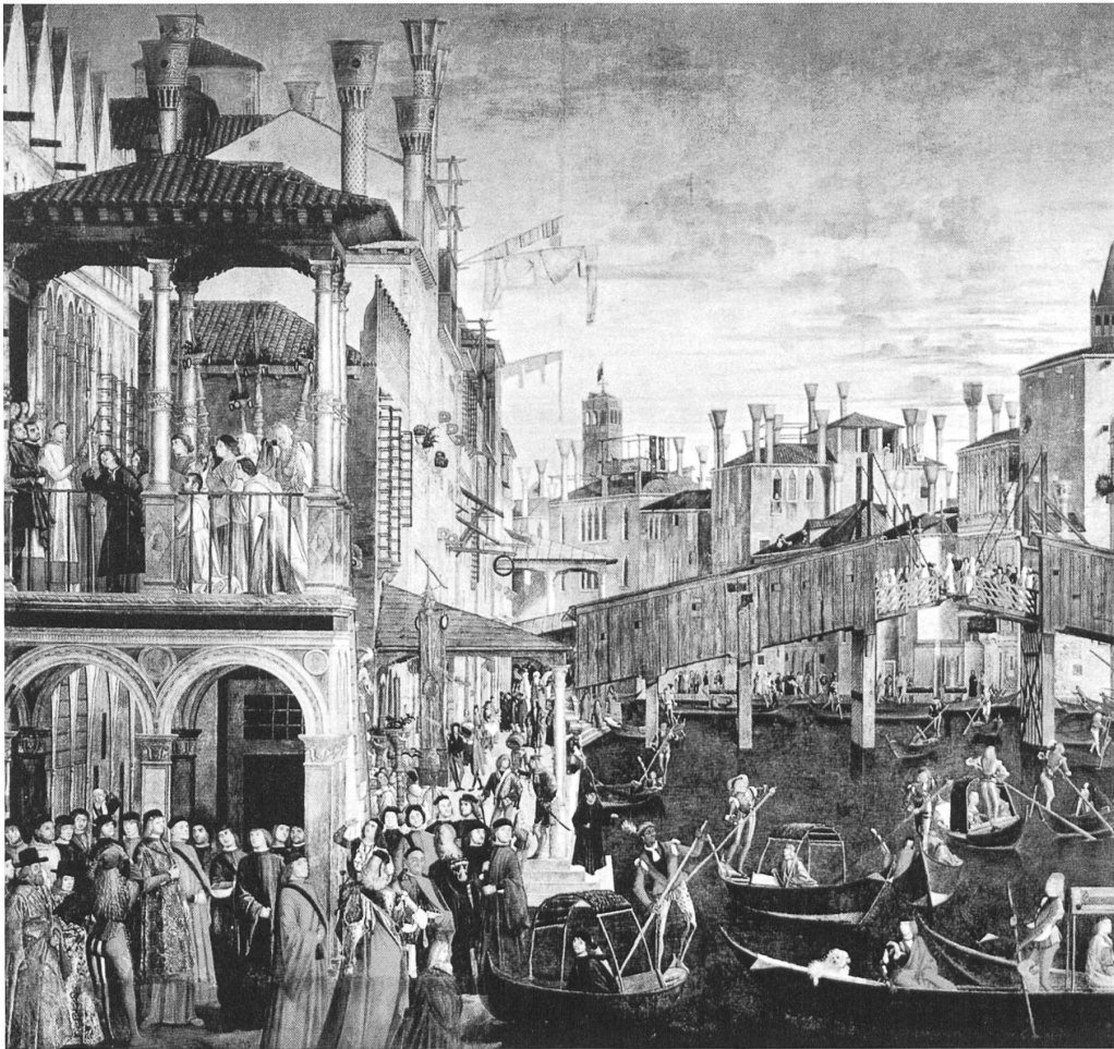
Die Rialto-Brücke in Venedig auf einem Bild von Vittore Carpaccio: Stadt als Gehäuse einer wundersamen Handlung. Bild: Miracolo della Croce a Rialto , Tempera auf Leinwand, Venedig ca. 1496. Heute in der Galleria dell'Accademia in Venedig.

Warschauer Lektionen titelte Thomas Schregenberger seinen Debatte-Essay im letzten Heft. Er plädierte für einen Städtebau in Anlehnung an den Sozialistischen Realismus, der unter der Führung der Architektur die Form vorangestellt und erkennbare, identitätsstiftende Räume geschaffen hat.