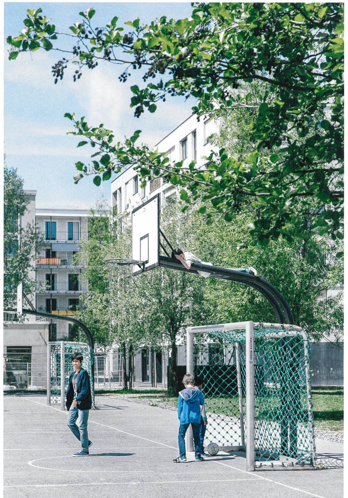
Unten: Der öffentliche Andreaspark grenzt im Süden direkt an die Siedlung