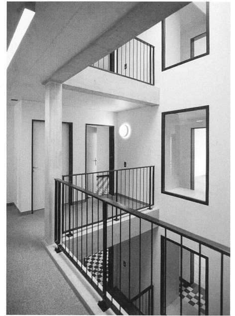
Links: Haus M, Duplex Oben: Haus B, Miroslav Šik Unten: Haus K, Miroslav Šik