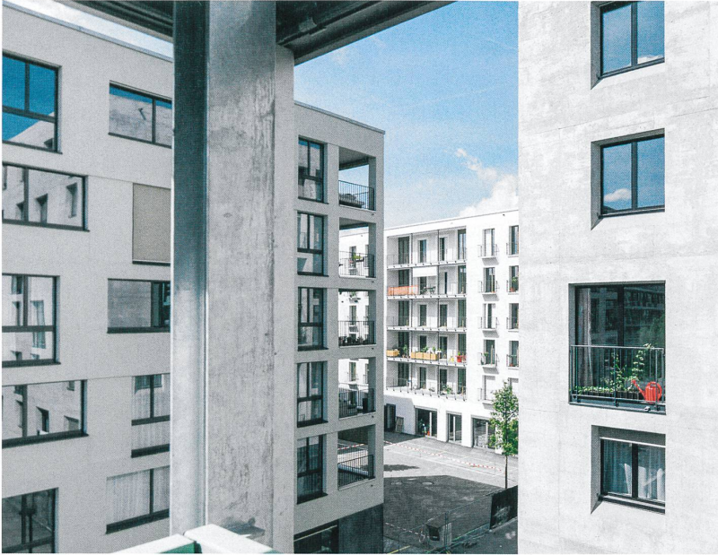
Links: Blick aus dem Wintergarten von Haus J auf die Häuser H (links), A und G