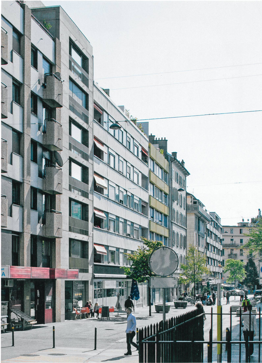
Oben: Genf, Les Pâquis, Rue de Môle, sieben- einhalb Geschosse auf acht Metern Breite; das Haus auf der kleinsten Parzelle hat die grössten Fenster.