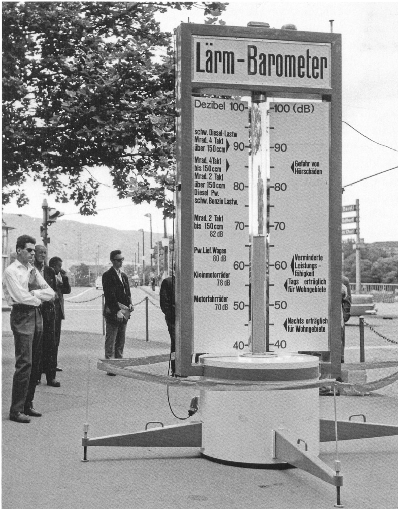
«Lärmbarometer, eine Neuheit. Der Lärm bleibt der alte». Werk-Chronik, Rubrik «Der Ausschnitt», in: Werk 6–1962, S. 193.

ist eine Norm allerdings erst, wenn ein Gesetz auf sie verweist.