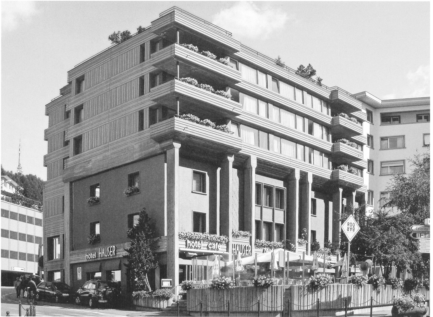
Der Umbau des Hotels Hauser in St. Moritz, 1969 – 71 von Robert Obrist, führt die Modernisierung Graubündens eindrücklich vor Augen.