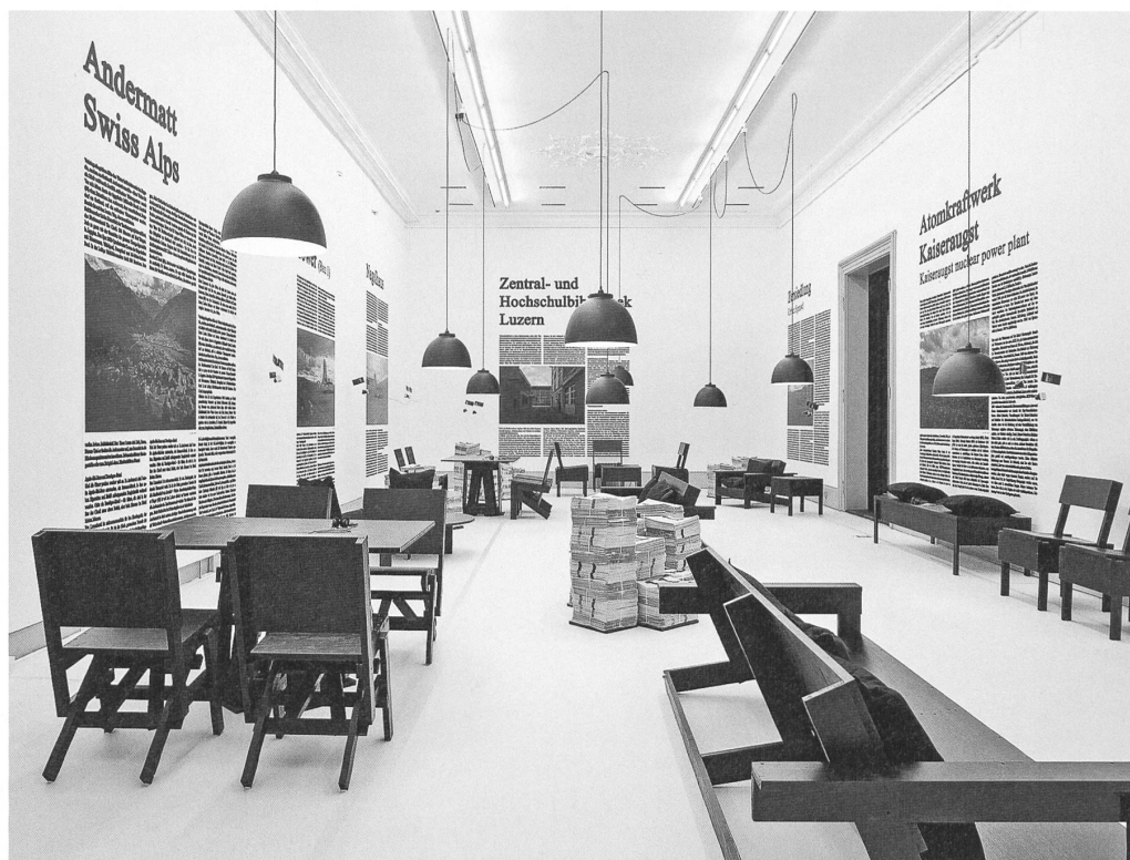
Architekturkritik in schwarz-weiss.